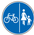
Getrennter Rad- und Gehweg

„Radfahrstreifen“ und „Schutzstreifen für Radfahrer“, die Sie an folgenden Markierungen erkennen, müssen ebenfalls benutzt werden: