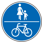
Gemeinsamer Geh- und Radweg